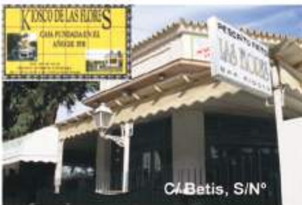
C/ Betis, S/Nº