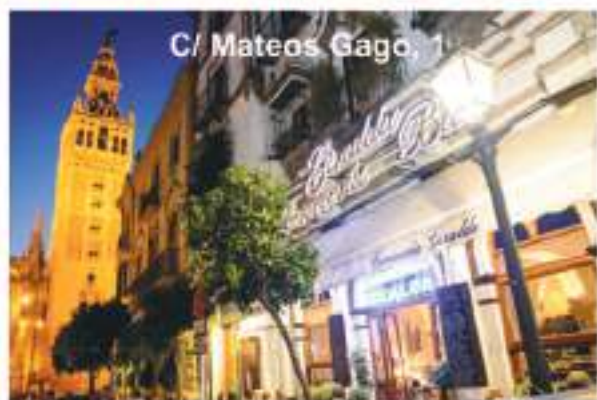
C/ Mateos Gago, 1