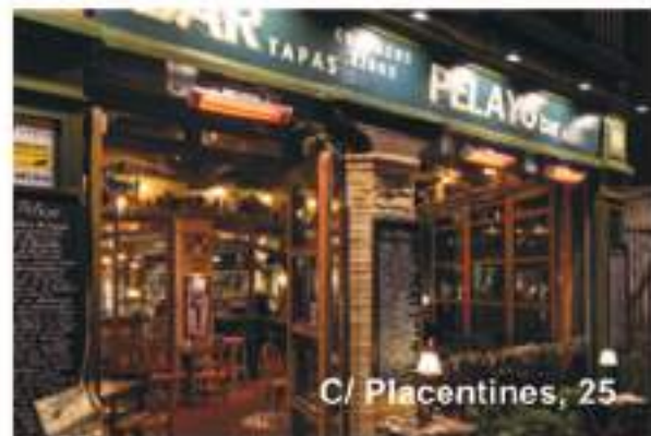
C/ Placentines, 25