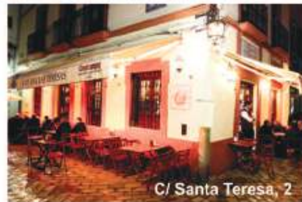
C/ Santa Teresa, 2