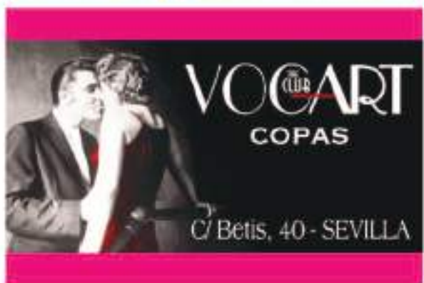
C/ Betis, 40 - SEVILLA