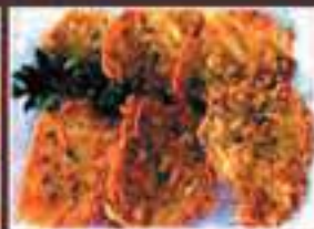
TORTILLITA CAMARONES SHRIMP "TORTILLITA"