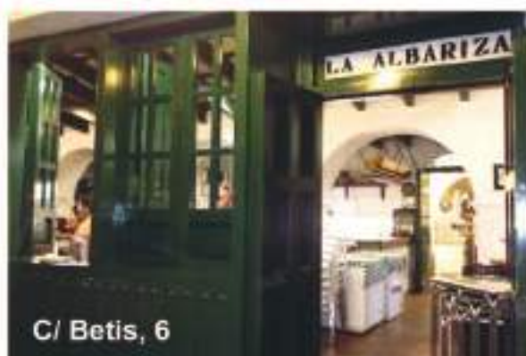
C/ Betis, 6