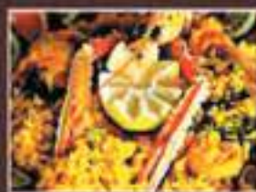
PAELLA RICE DISH