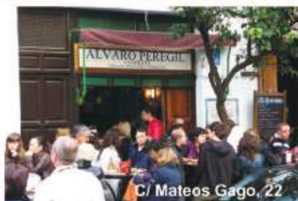
C/ Mateos Gago, 22