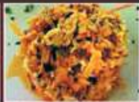
REVUELTO DE BACALAO SCRAMBLED EGGS WITH COD