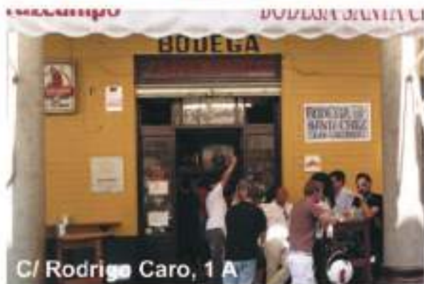
C/ Rodrigo Caro, 1 A