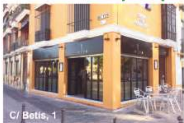
C/ Betis, 1