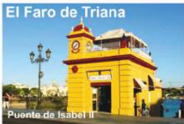
El Faro de Triana