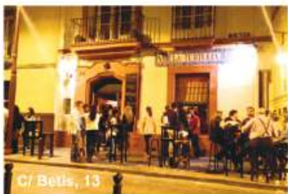
C/ Betis, 13