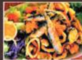
PESCAITO FRITO DEEP FRIED ASSORTED FISH