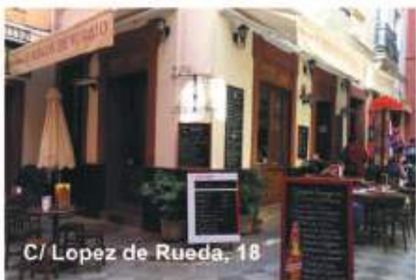
C/ Lopez de Rueda, 18