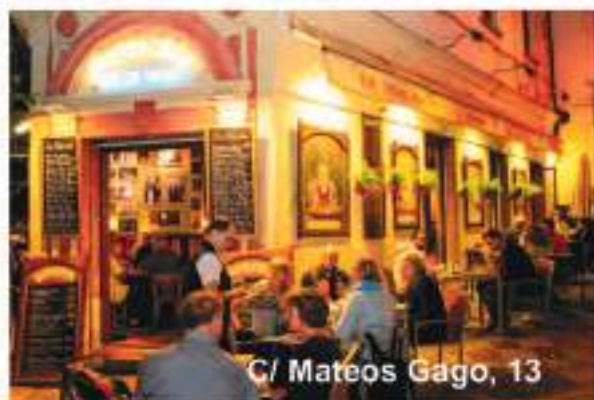
C/ Mateos Gago, 13