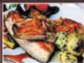
DORADA GILT-HEAD BREAM