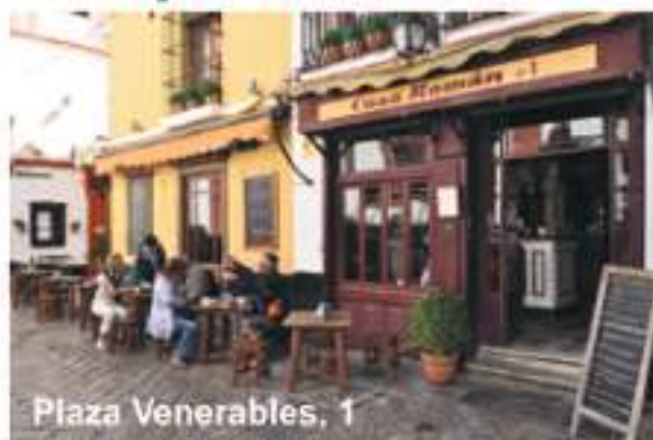
Plaza Venerables, 1