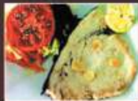
PEZ ESPADA SWORDFISH