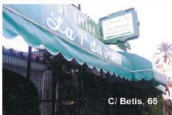
C/ Betis, 66