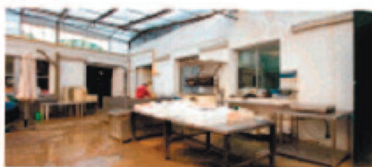
Cocedero y saladero