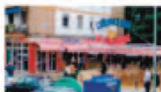
Cervecería San Jacinto