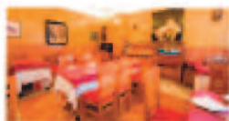
Ostrería La Mar