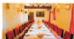
Salón de Celebraciones