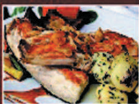
DORADA GILT-HEAD BREAM