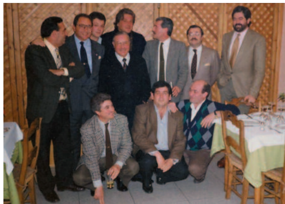
Momento del homenaje al ex-presidente José Nuñez Naranjo.