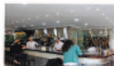
Mesón La Sierra

Av de Coria, 5, 41011 Sevilla Tif.: 954 33 40 91 www.mariscos-emilio.com/