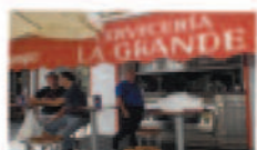
Cervecería La Grande

La tradición y el buen saber aprendido a lo largo de los años