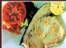
PEZ ESPADA SWORDFISH