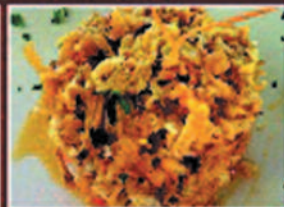
REVUELTO DE BACALAO SCRAMBLED EGGS WITH COD