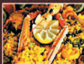
PAELLA RICE DISH