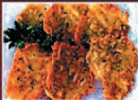
TORTILLITA CAMARONES SHRIMP "TORTILLITA"