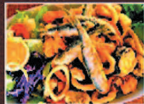
PESCAITO FRITO DEEP FRIED ASSORTED FISH