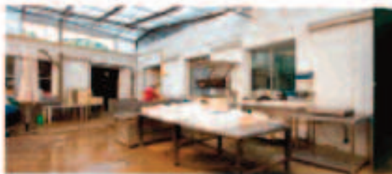
Cocedero y saladero