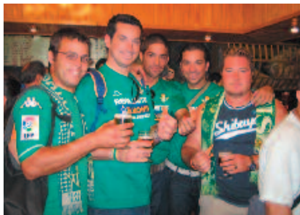
Así llegamos a Madrid con muchas horas de antelación a la final.