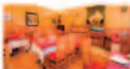
Osirería La Mar