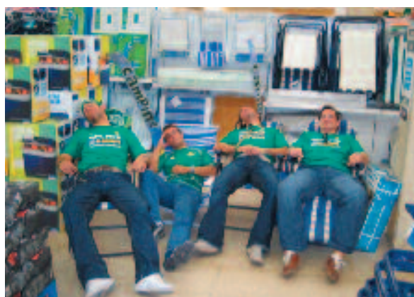
Tantas horas que el cansancio venció a los redactores.