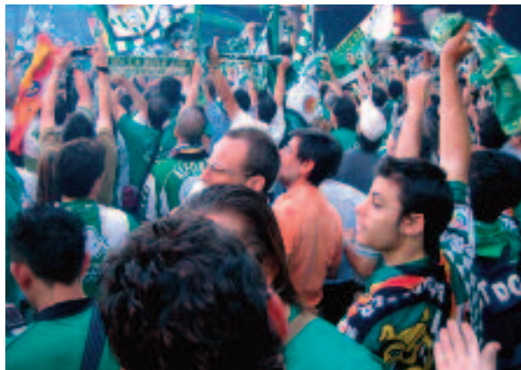
El Manzanares era verdiblanco.