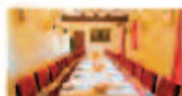
Salón de Celebraciones