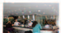
Mesón La Sierra

Av de Coria, 5, 41011 Sevilla Tlf.: 954 33 40 91 www.mariscos-emilio.com/