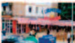
Cervecería San Jacinto