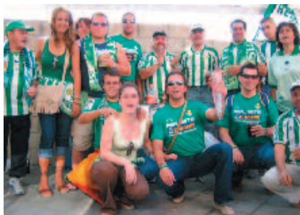
Se brindó con los aficionados por el deseo de ver al Betis Campeón.