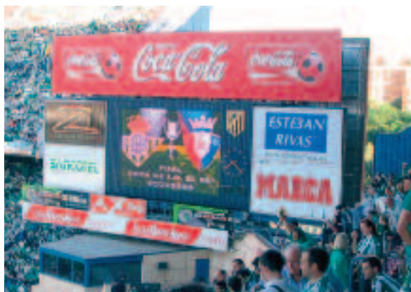
Hasta el marcador estaba listo para reflejar al final la victoria bética.