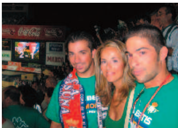
Y el marcador reflejaba el 2-1 a favor del Real Betis y nuestros redactores felices.