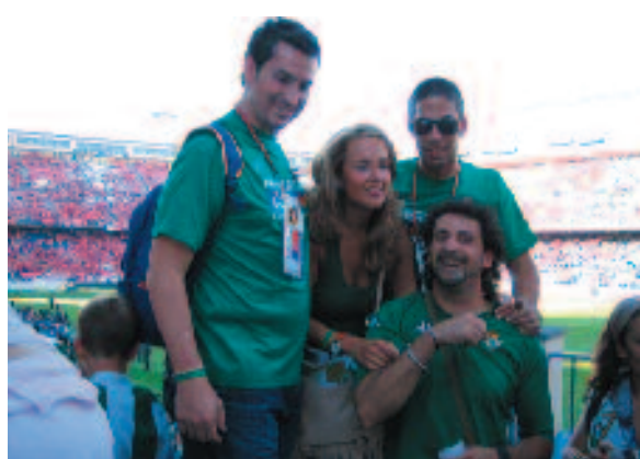
Ya en el Manzanares todo preparado para la gran final