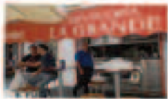
Cervecería La Grande

La tradición y el buen saber aprendido a lo largo de los años