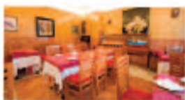
Ostrería La Mar