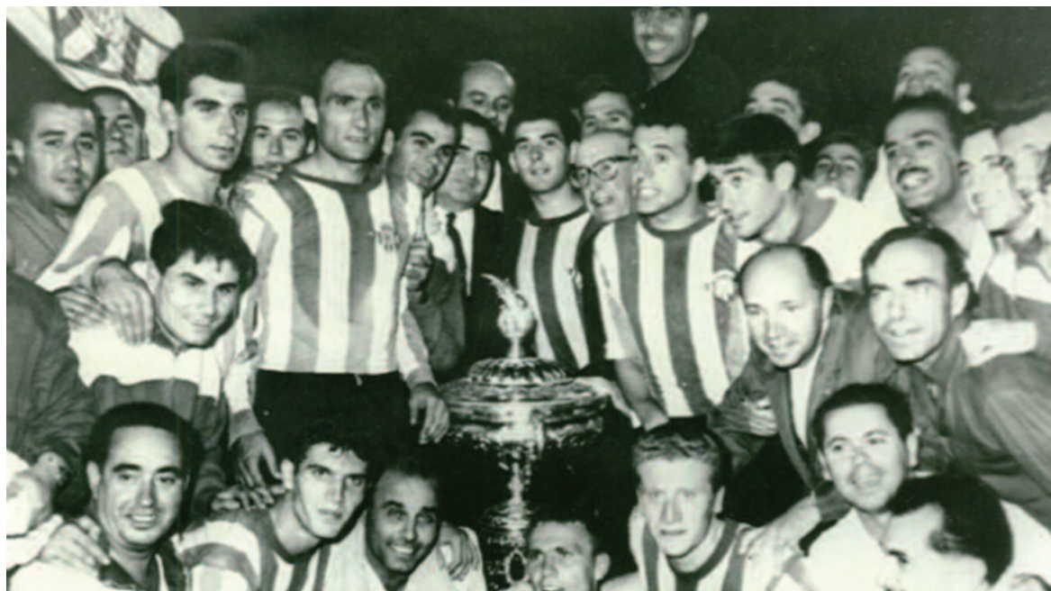
R. Betis, Campeón del Trofeo Carranza 1963