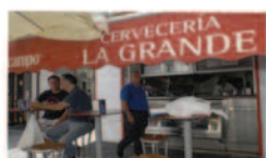
Cervecería La Grande

La tradición y el buen saber aprendido a lo largo de los años