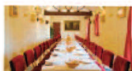
Salón de Celebraciones