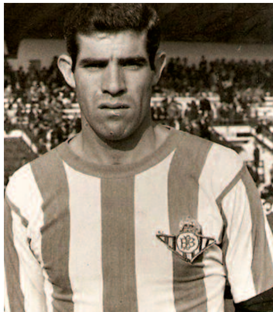
Luis Aragonés año 1963