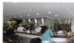
Mesón La Sierra

Av de Coria, 5, 41011 Sevilla Tlf.: 954 33 40 91 www.mariscos-emilio.com/