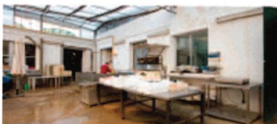
Cocedero y saladero