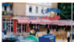
Cervecería San Jacinto