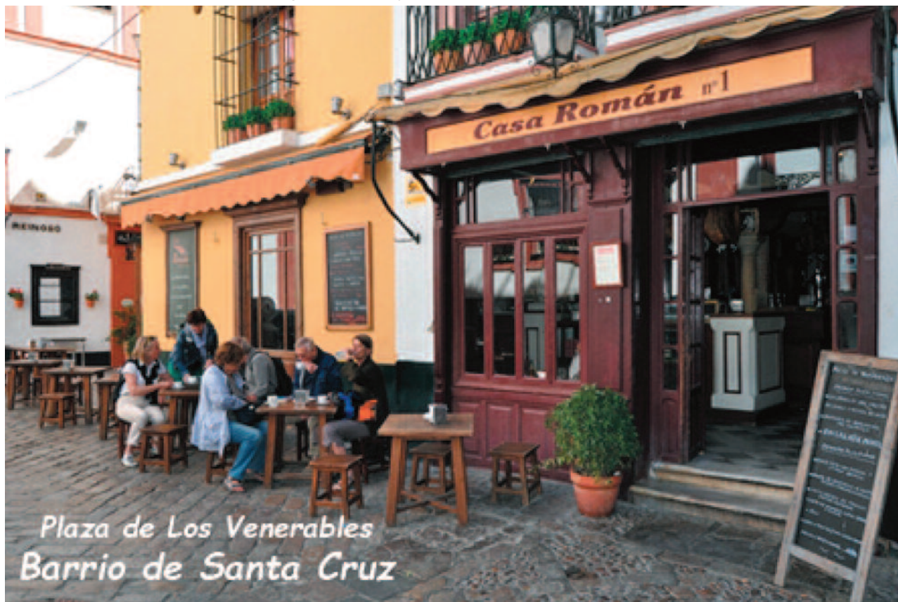
Plaza de Los Venerables Barrio de Santa Cruz

de 2016, aunque los emisarios de Chamartín han optado por acelerar el asunto y concretar una gestión que se había gestado desde el anterior capítulo. No podemos criar y formar futuras figuras para los poderosos...¡¡¡YA ESTÁ BIEN!!!.