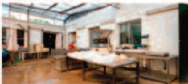
Cocedero y saladero