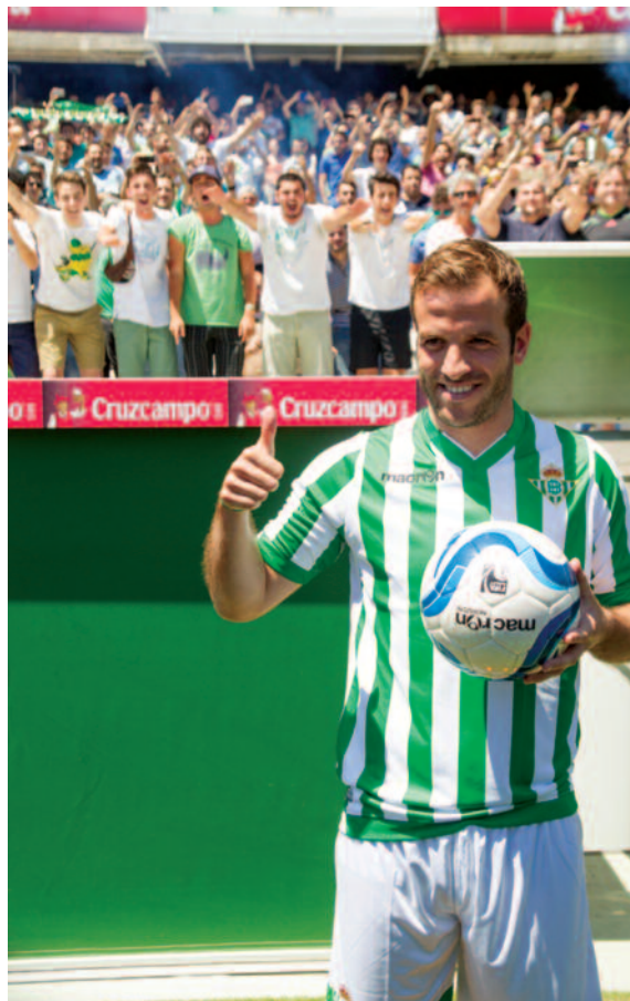
Momentos de su presentación a los miles de aficionados que se dieron cita en el Villarreal para ver a su nuevo ídolo.