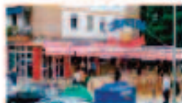
Cervecería San Jacinto