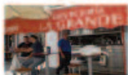
Cervecería La Grande

La tradición y el buen saber aprendido a lo largo de los años