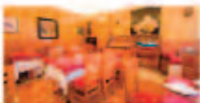
Ostrería La Mar