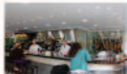
Mesón La Sierra

Av de Coria, 5, 41011 Sevilla Tif.: 954 33 40 91 www.mariscos-emilio.com/