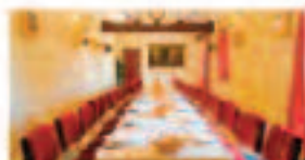
Salón de Celebraciones