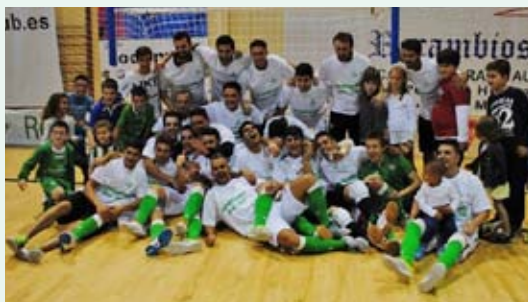
FÚTBOL SALA: "CAMPEONES DE LIGA CON BUEN JUEGO"