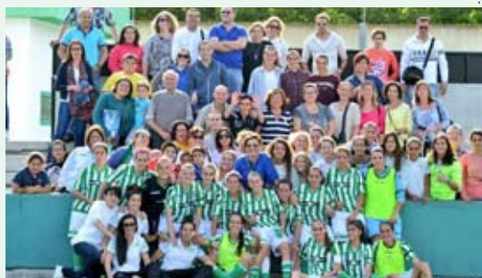
FÉMINAS: "GRAN VICTORIA PARA CERTIFICAR LA PROMOCIÓN"