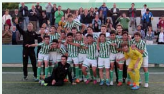
CADETE B: "VICTORIA QUE VALE UN CAMPEONATO"