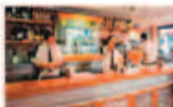
MESÓN LA SIERRA

Mariscos Emilio - Central y Cocedero: Avenida de Coria 7 y 9 SEVILLA Teléfonos: 954 334 091