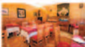
OSTRERIA LA MAR