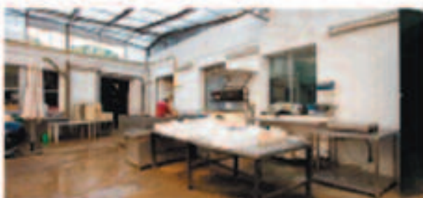
COCEDERO Y SALADERO