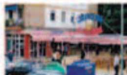
CERVECERIA SAN JACINTO