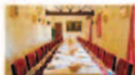
SALÓN DE CELEBRACIONES