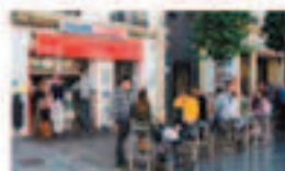
CERVECERIA LA GRANDE

La tradición y el buen saber aprendido a lo largo de los años