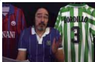
Camiseta del Betis y el "3" de Rafael Gordillo como fondo en un vídeo del prestigioso diario francés L'EQUIPE.