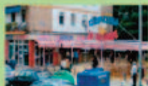
CERVECERIA LA GRANDE

La tradición y el buen saber aprendido a lo largo de los años