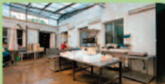
COCEDERO Y SALADERO