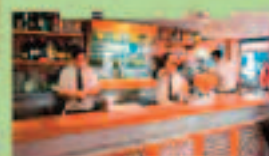
MESÓN LA SIERRA

Mariscos Emilio · Central y Cocedero: Avenida de Coría 7 y 9, Sevilla · Teléfono 954 334 091