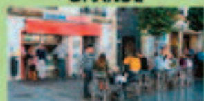
CERVECERIA SAN JACINTO