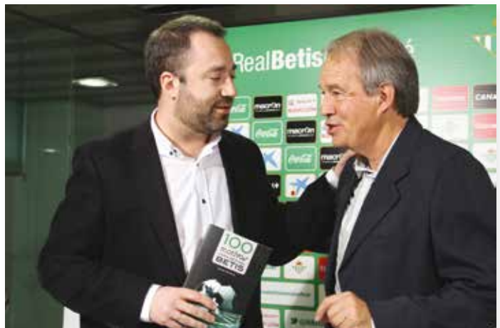
EL AUTOR CON EL LIBRO EN LA MANO HABLANDO CON ANZARDA

Los ejemplares se pueden adquirir en librerías, como Reguera en el Barrio de Santa Catalina (librería donde podemos encontrar la mayoría de los libros con temática verdiblanca), centros comerciales y en la propia tienda oficial del Real Betis Balompié.