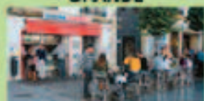
CERVECERIA SAN JACINTO