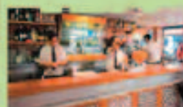
MESÓN LA SIERRA