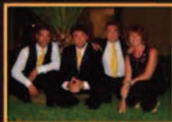
ORQUESTA THE DIAMONDS