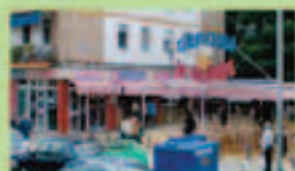
CERVECERIA LA GRANDE

La tradición y el buen saber aprendido a lo largo de los años