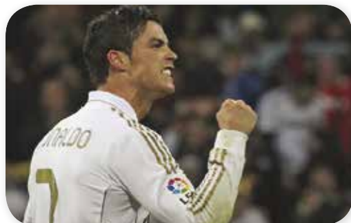
C. Ronaldo es el referente blanco