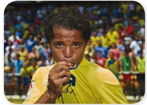
Gio Dos Santos es la referencia de este Villarreal en ataque

En el retorno a Primera el submarino amarillo llega con un equipo cuajado en la temporada pasada en la Segunda división. La directiva le dio las riendas a Marcelino y el entrenador ha ido formando un bloque que está dando muchas alegrías en estas primeras semanas de competición.