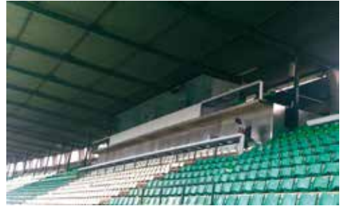
Nuevas cabinas y pupitres de prensa en Voladizo.

Con motivo de la necesaria adecuación del Estadio por la competición europea, las instalaciones de los medios de comunicación ubicadas en la grada de Voladizo han sido remozadas en su totalidad, incluyendo cabinas, sets de retransmisión y los pupitres de la prensa escrita.