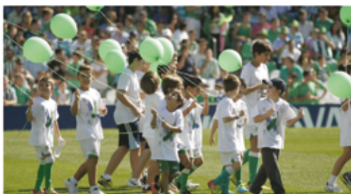
Imagen del Real Betis que refleja la ilusión y presencia de cientos de pequeños el pasado domingo en el Día del Niño Bético en el Benito Villamarín. Los alumnos de la Escuela de Fútbol de la Fundación RBB saltaron al campo para celebrarlo.