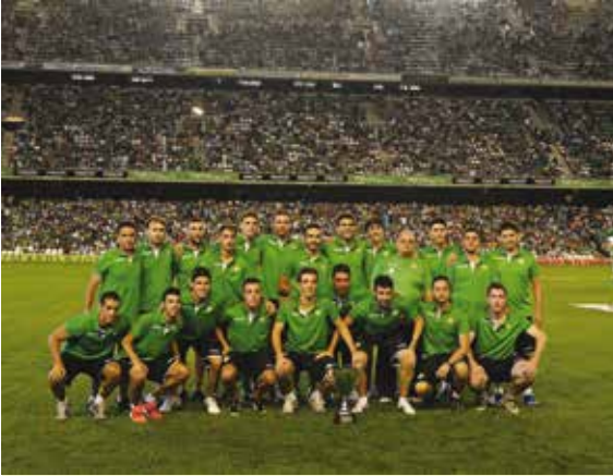
El equipo de fútbol sala en el Villamarín con el trofeo de Campeón de Andalucía.

En el partido ante el Valencia el Real Betis Balompié FSN ofreció a la afición el trofeo de Campeón de Fútbol Sala de Andalucía, obtenido este mes al vencer por 2-1 al Racing Kallan Doors Alameda en la final celebrada en Baena.