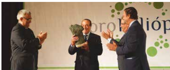
Momento de la entrega del II Galardón Heliópolis a Curro Romero