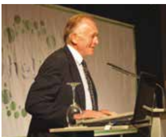
El olímpico Gerardo Seeliger fue el conferenciante invitado de la noche