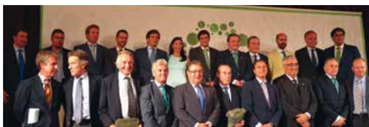
Foto de familia de invitados y miembros del Real Betis Balompié y la Fundación Heliópolis