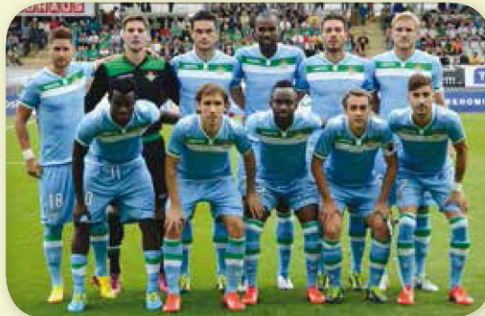
Once inicial verdiblanco en el partido de ida

I mportante, muy importante el choque de esta noche en el Villarmarín. Vuelve el fútbol europeo a Heliópolis con un choque que debe servir para asegurar el pase verdiblanco a la fase de grupos de la Europa League teniendo en cuenta el buen resultado cosechado en tierras checas pese a la mala imagen mostrada.