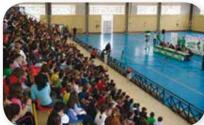
El pabellón de Montequinto lleno a rebozar de escolares de Dos Hermanas.

Montequinto protagonizó el martes 2 una masiva edición de “Del Cole al Fútbol”, con más de 700 niños de los Colegios Europa y Luis Cernuda . Salva Sevilla y Mario contestaron las preguntas de los escolares y Palmerín hizo realidad el sueño de pequeños y mayores de obtener una instantánea con la mascota verdiblanca, La próxima sesión tendrá lugar el 24 de Abril en la sede de la Fundación Cajasol , patrocinador principal del programa educativo.