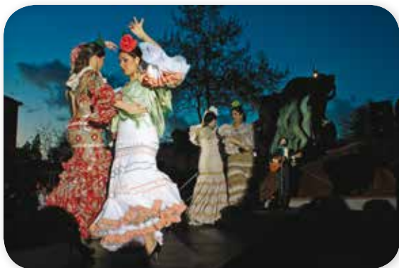
Fondo volvió a vivir actividades previas a un partido. La moda flamenca fue la protagonista, con las sevillanas de Plaza Nueva

Información sobre inscripciones y becas en www.escuelafbetis.org , en el perfil de Twitter @EscuelaFBetis , en el teléfono 954 29 65 35 y en las oficinas de la Fundación en el Estadio Benito Villamarín.