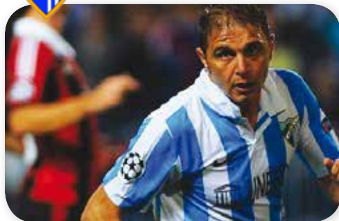
El portuense y bético Joaquín es uno de los pilares fundamentales de este Málaga de Champions

Los delanteros Saviola (7 goles) y el ex bético Roque Santa Cruz (5 goles) se reparten los minutos en el ataque.