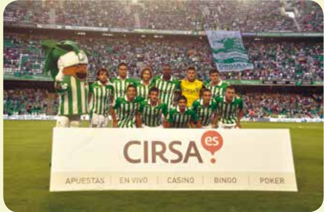
Primera alineación de partido oficial en el Villamarín

El cuadro "periquito", tras un verano marcado por múltiples salidas (Álvaro, Javi Márquez, Romaric, Didac, Weiss o Coutinho), afronta la temporada con la llegada de jugadores que aúnan experiencia y juventud como Capdevilla, Colotto, Simao, Stuani, Tejera o Wakaso. Todo un reto para un Pochettino que ya ha demostrado su valía y que apuesta claramente por la cantera.