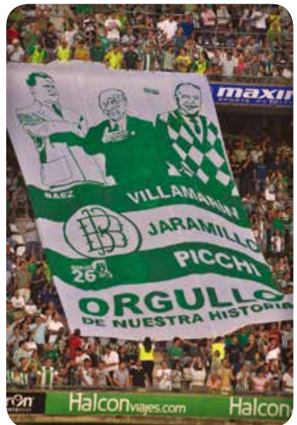
Tifo de Betisweb en Fondo.

Sin duda, mitos ya en verdiblanco que, como se podía leer en unas pancartas que acompañaban a uno de los tifos, “lucharon como campeones para irse como leyendas”. Cuidadnos desde el cuarto anillo. DEP.