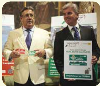
El Alcalde Zoido y el Presidente Guillén

En los días de partido se incrementarán las líneas 1, 2 y 6 posibilitando la llegada de muchos béticos hasta la misma puerta del Estadio. Se pondrá en marcha una campaña con el lema 'Déjate llevar por tus colores', que tiene como elemento central la edición especial y limitada de Tarjetas Multiviajes con el diseño del Real Betis Balompié, que se pueden conseguir en los Puntos de Venta y Recarga distribuidos por toda la ciudad y en la tienda del club.