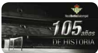
Banner de la web www.realbetisbalompie.es

Este año se conmemora el 105 aniversario fundacional del Real Betis Balompié, y por tal motivo traemos a nuestras páginas la imagen creada por el club para su web y el logo realizado por Juan Carlos Pérez "Reontra" para Betisweb.