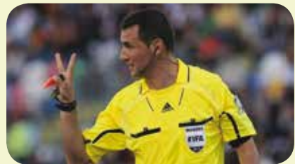
Un arbitro con buen recuerdo copero

Eso sí, este árbitro estuvo presente en dos choques coperos de grato recuerdo para el beticismo. Concretamente, en las victorias ante Getafe (1-3) y Barcelona (3-1) de la campaña 2010-2011.