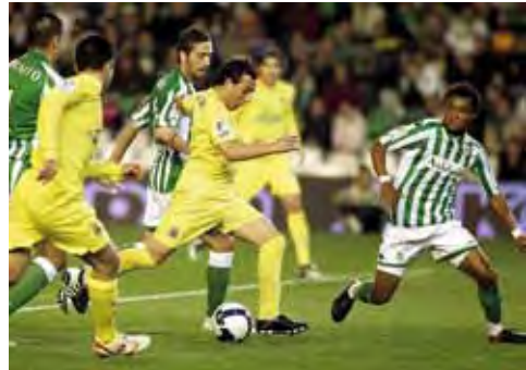
Imagen del último choque en Heliópolis donde se empató a dos goles

La última vez que el Betis ganó en su recinto de la Palmera al Villarreal fue en la temporada 2004-05, gracias a dos goles del brasileño Ricardo Oliveira. Del equipo verdiblanco de aquel año actualmente no queda hoy en día ninguno de los que jugaron ese partido contra el Villarreal. Son ocho años los que el Betis lleva sin ganar a los levantinos en Heliópolis, quienes comienzan a subirse al carro de las "bestias negras" de los últimos años en campo blanquiverde, junto a Español, Sevilla u Osasuna, entre otros.