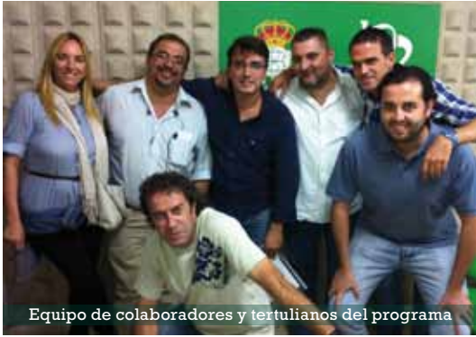
Equipo de colaboradores y tertulianos del programa