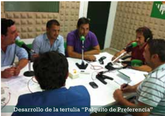
Desarrollo de la tertulia "Palquito de Preferencia"